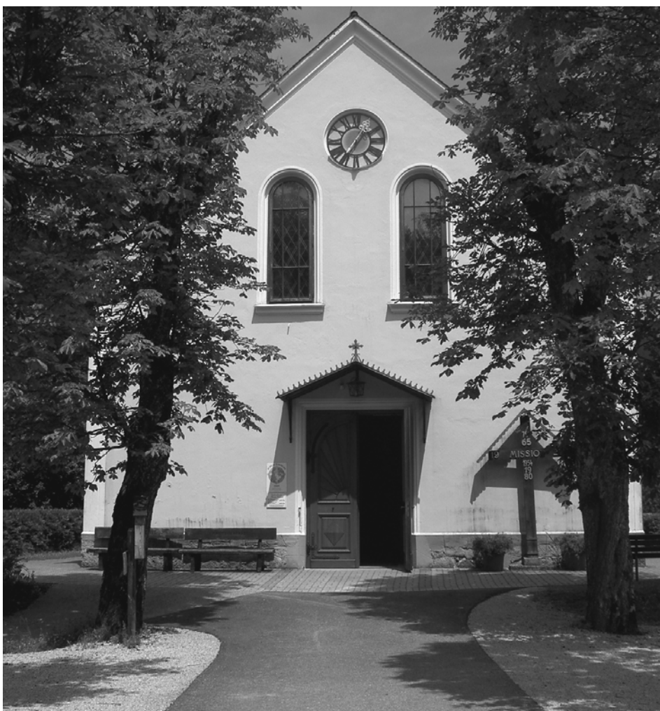
Wallfahrtskirche von Maria Seesal